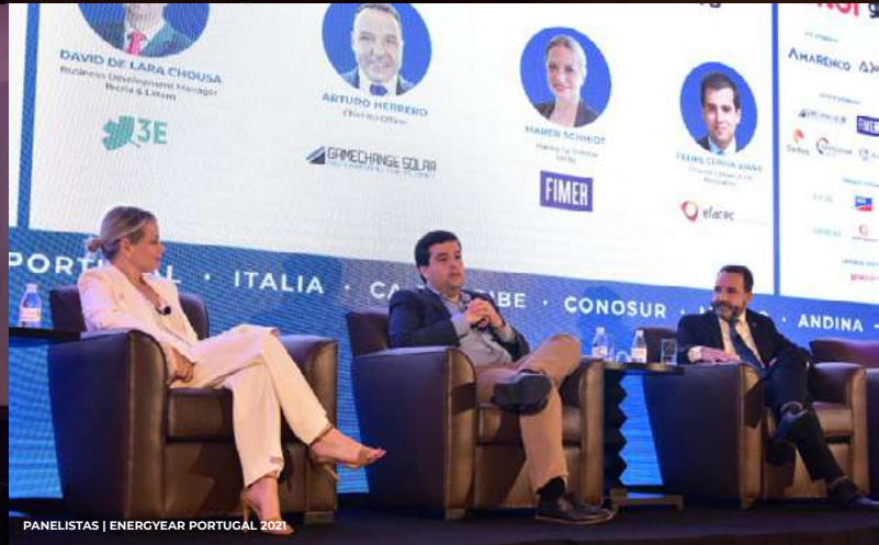
PANELISTAS | ENERGYEAR PORTUGAL 2021