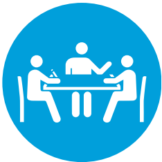
SALAS DE CONFERENCIA CONTINUAMENTE DESINFECTADAS