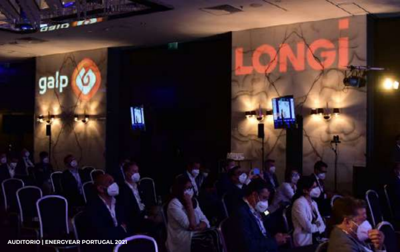
AUDITORIO | ENERGYEAR PORTUGAL 2021