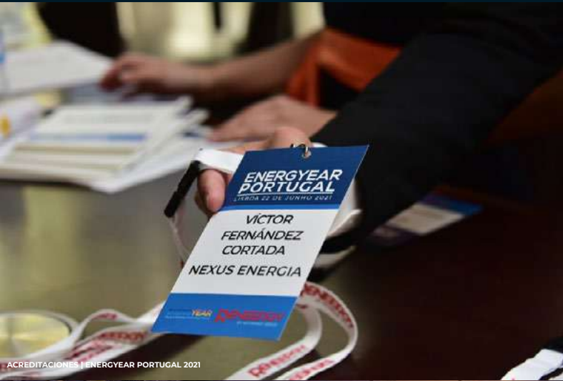
ACREDITACIONES | ENERGYEAR PORTUGAL 2021