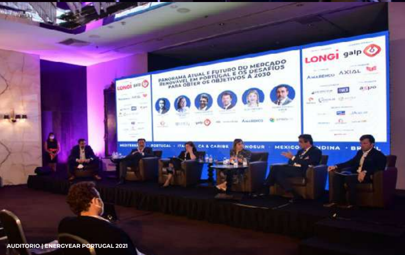
AUDITORIO | ENERGYEAR PORTUGAL 2021