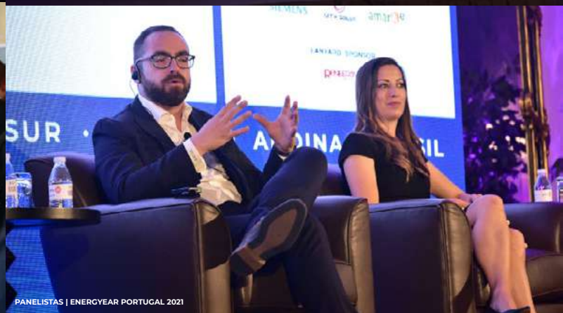
PANELISTAS | ENERGYEAR PORTUGAL 2021