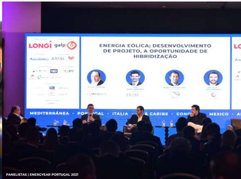
PANELISTAS | ENERGYEAR PORTUGAL 2021