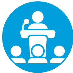
AFORO 1/3 DE CAPACIDAD