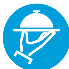
CAFÉ Y BUFFET SERVIDO