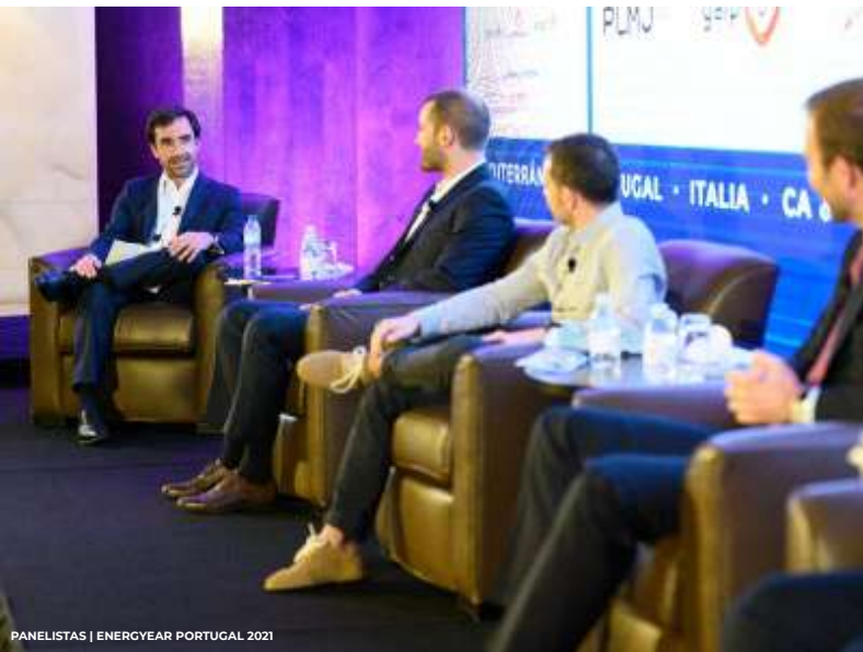
PANELISTAS | ENERGYEAR PORTUGAL 2021