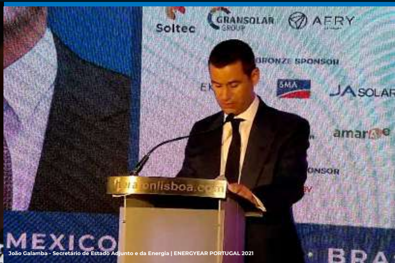
João Galamba - Secretário de Estado Adjunto e da Energia | ENERGYEAR PORTUGAL 2021