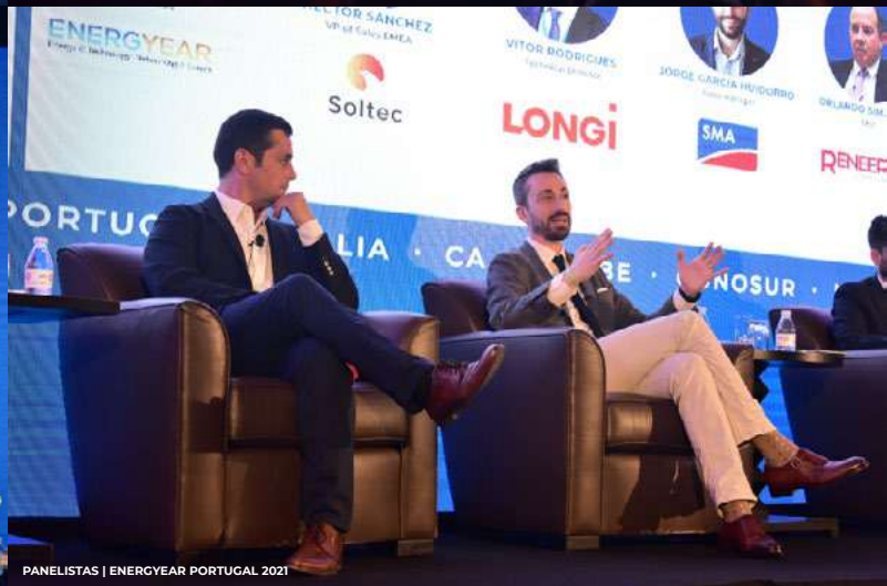
PANELISTAS | ENERGYEAR PORTUGAL 2021