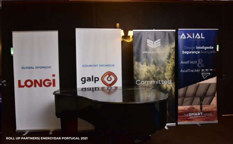
ROLL UP PARTNERS | ENERGYEAR PORTUGAL 2021