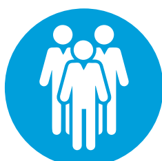
SALAS DE NETWORKING SOBREDIMENSIONADAS