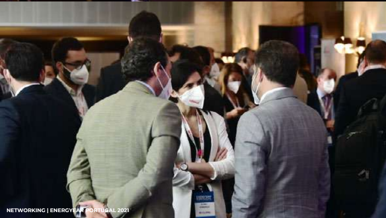
NETWORKING | ENERGYEAR PORTUGAL 2021