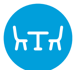
1.5 MTS SEPARACIÓN BUFFET