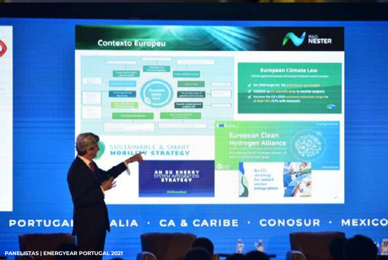
PANELISTAS | ENERGYEAR PORTUGAL 2021